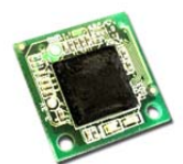
「IC チップ ABC-CORE」