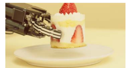
「リアルハプティクス技術（力触覚技術）」