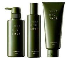
「SUNA パーフェクトセット（製品セット）」